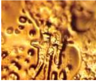
Molécule exposée au son de la voix d'Adolph Hitler.