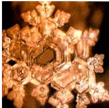
Molécule exposée au son d'un Rock Heavy Métal.