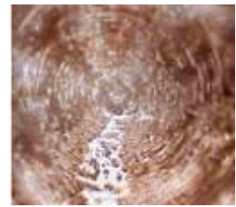
Molécule exposée au son de "Merci Beaucoup".