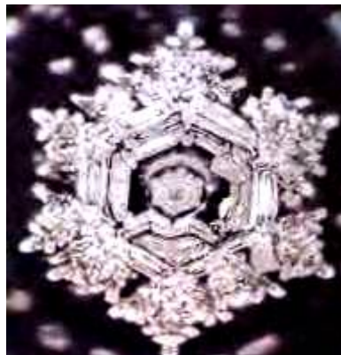
Molécule exposée à l'énergie du son d'une Aria pour cordes en Sol de Bach.